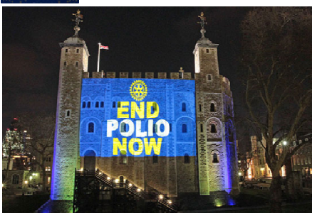
The Tower of London